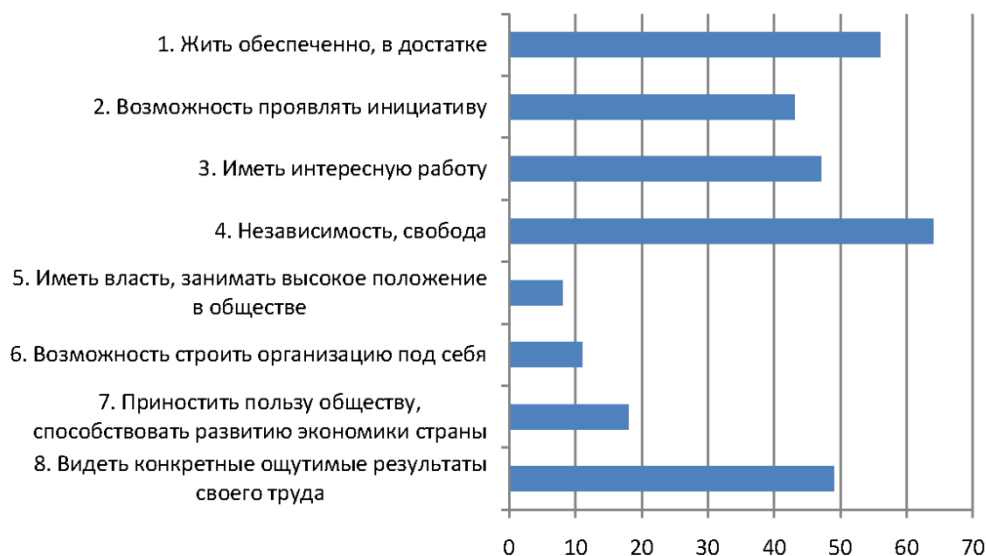
Рис. 1. Мотивы и ценности предпринимателей (в процентах к опрошенным, n = 208 )

лей составила 208 человек) также подтвердило наличие у них высокого уровня мотивации достижения. В представленном рис. 1 пункт 1 определяет материальную, или потребительскую, мотивацию; пункты 5, 6 – статусную; 2, 3, 4, 7, 8 – инновационно-творческую. Почти половина респондентов в качестве основного мотива своей деятельности отметили «независимость, свободу» и «видеть конкретные, осязаемые результаты своего труда».